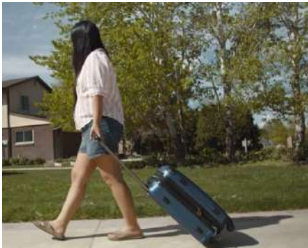
Huéspedes de Airbnb

Para usuarios temporales como personal de diferentes servicios, huéspedes, o repartidores, basta con otorgarles códigos temporales o Ekeys para habilitar el acceso programado. Funciona con o sin teléfono. Compartimos algunos ejemplos: