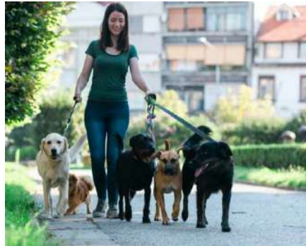
Niñeras, encargados de paseo de perros, personal de limpieza o mantenimiento

Acceso limitado por fecha y hora. Siempre se puede utilizar dentro del rango establecido y caduca automáticamente.