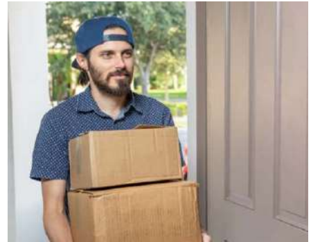
Repartidores, o contratistas

Limitado por día de la semana y hora. Se puede utilizar de forma recurrente dentro de los días y horarios establecidos.